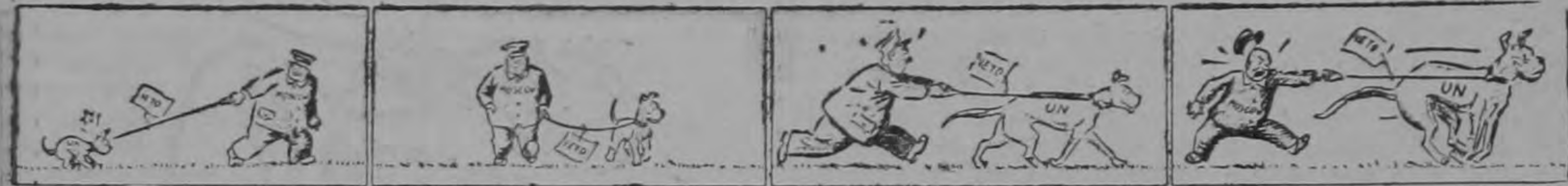
El can que ha ido creciendo.