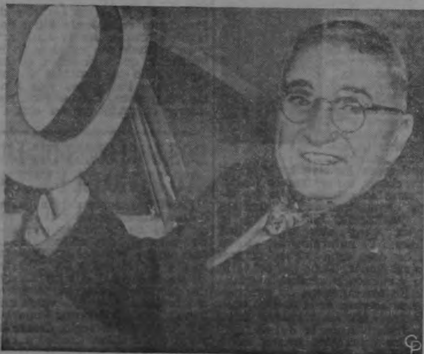
El Presidente Truman aparece aquí en su automóvil en Kansas City, Misuri, momentos antes de tomar su avión para regresar a Washington después de sus vacaciones de Navidad que duraron 4 días.