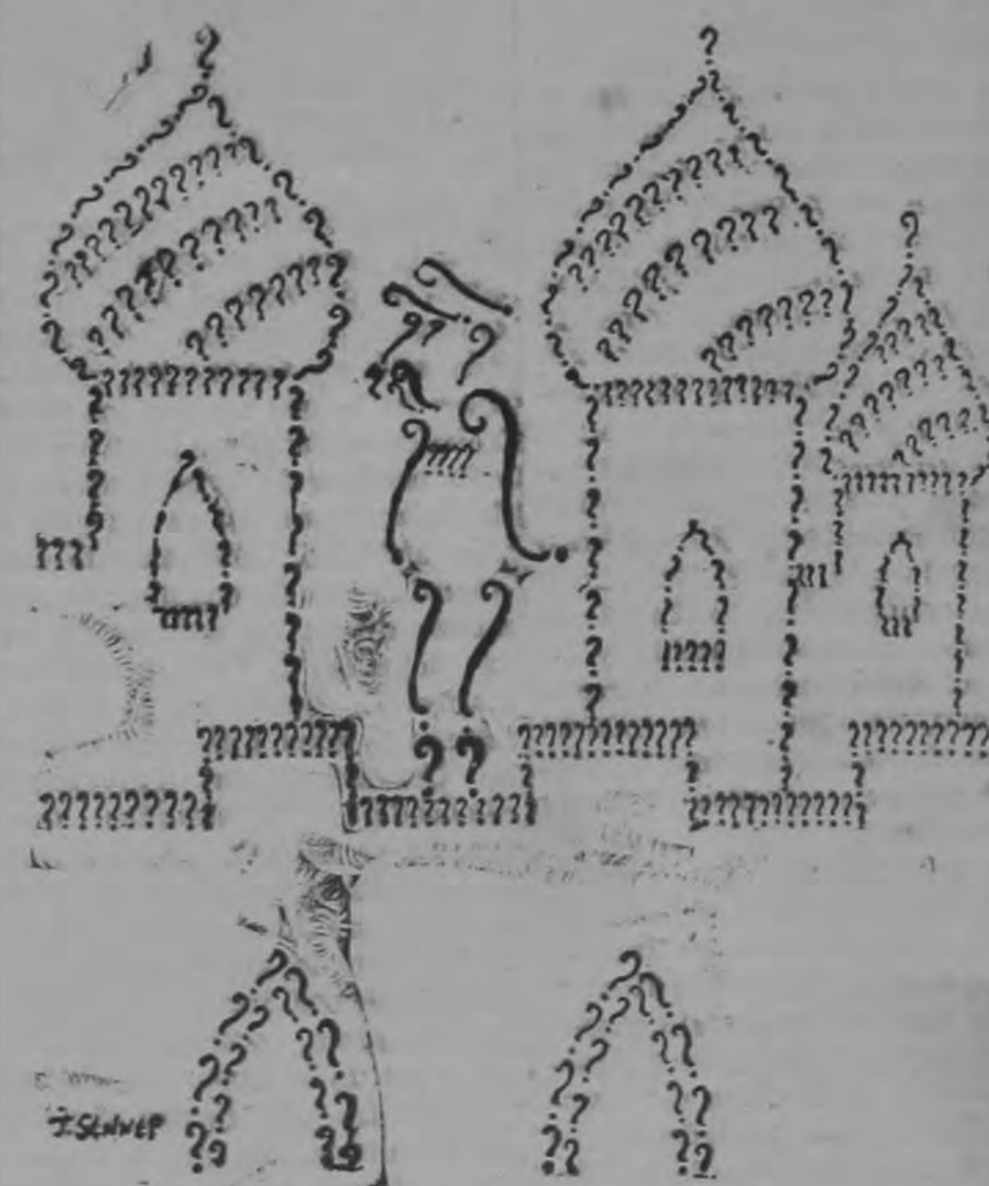
La gran interrogación.

tos del año: 1) el creciente malestar económico de Europa, estrujada hasta donde no puede por el rearme, por lo cual los representantes de sus distintos pueblos están por cuanto pueda significar aligeramientos de la pesada carga y 2) el creciente alejamiento, que va alcanzando abierta hostilidad, de los países islámico-asiáticos con respecto a Occidente.