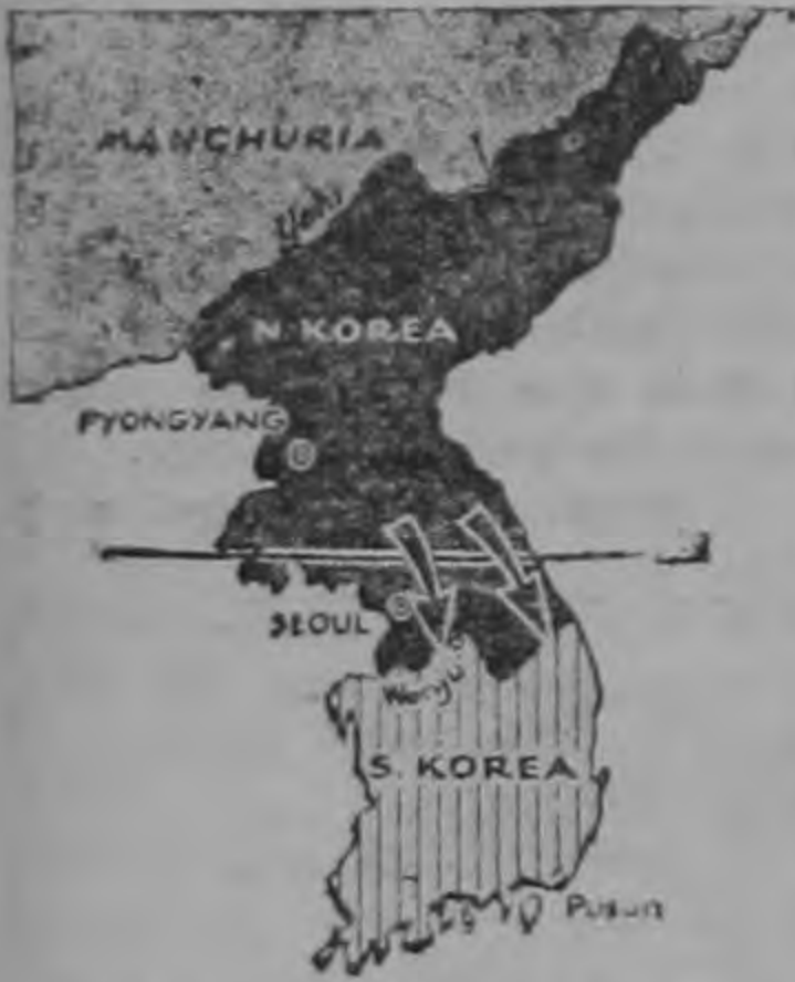
En Marzo de 1951