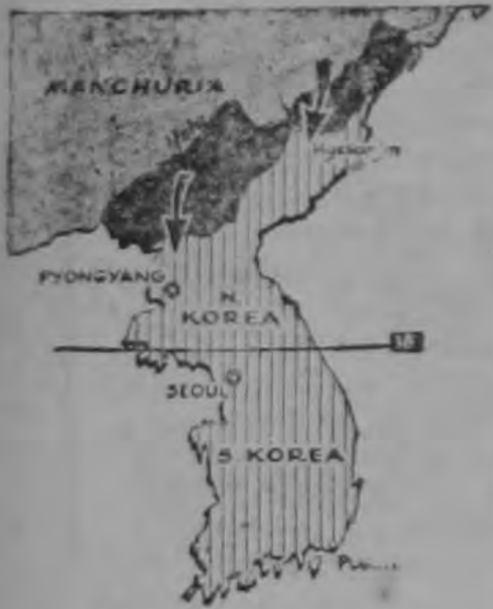
En Enero de 1951