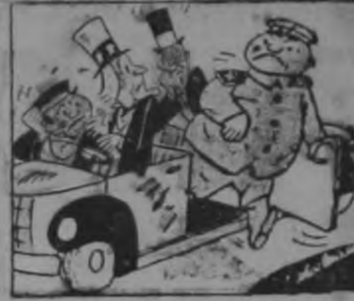
El paseo hacia el desarme.

La realidad, durante el 51 y por cuanto respecta a uno de los senderos que es preciso recorrer para llegar a la paz estable, el del desarme, ha sido bien distinta. Vista desde un ángulo occidental está representada por la historieta muda "El paseo hacia el desarme". — Muy probablemente del lado soviético la ven a la inversa, recayendo toda la culpa de los fracasos desarmamentistas sobre las figuritas que representan al Tío Sam, John Bull y Francia.