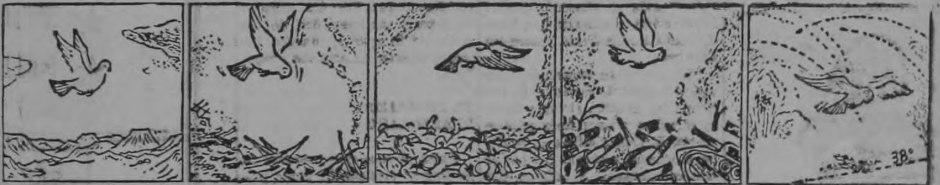
La paloma de la paz durante el año.