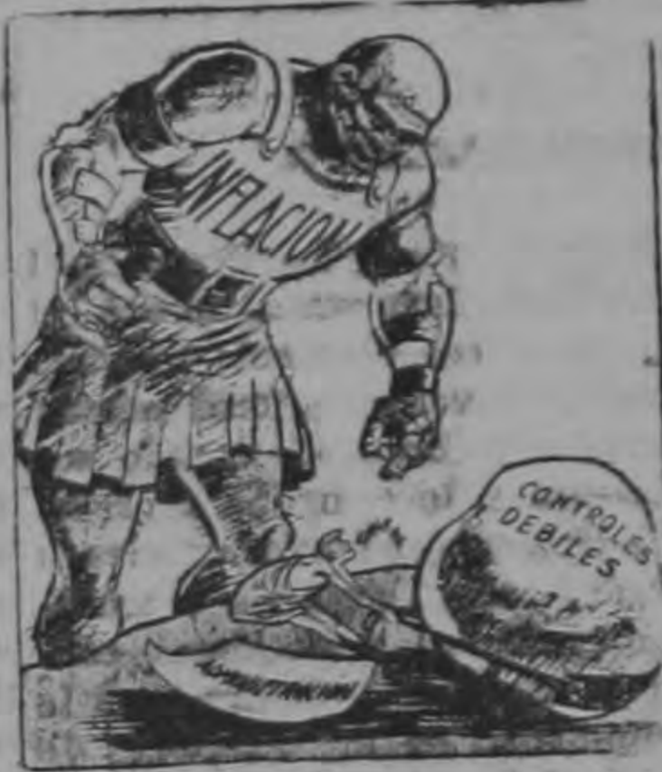
Vencerá el moderno David? Símbolo N. U.

Así como el temor a la guerra ha sido, todo el año, la nota a la sordina reverberando sobre actos, anhelos y pensamientos, así el fantasma de la inflación ha sido el problema más serio que ha terminado por convertirse en apremiante para el mundo occidental.