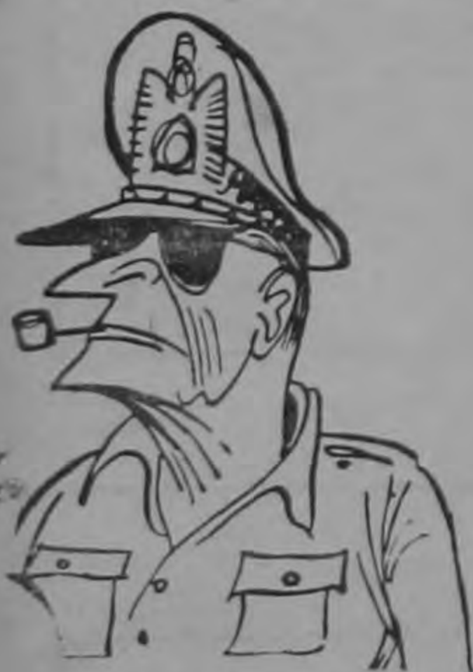
Gral Mac Arthur

Tal vez otra gota que contribuyó a colmar el vaso rojo en Corea fue la espectacular amenaza del Gral. Mac Arthur de bombardear las bases chinas en Manchuria. En todo caso la destitución del brillante general norteamericano y su cola de marchas triunfales, investigaciones senatoriales