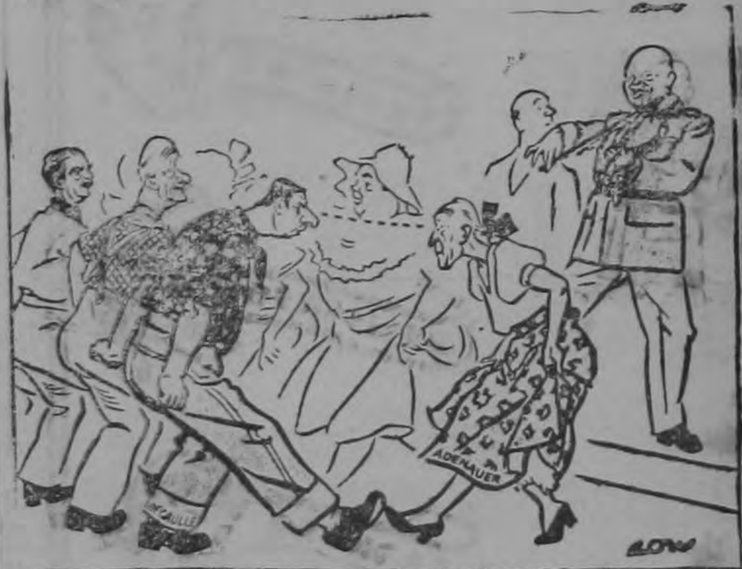
La danza de la NATO.

Mientras los propósitos armamentistas habían estado en el papel las presiones inflacionistas no habían sido demasiado serias. Pero tan pronto como los Estados Unidos comenzaron a transformar en fábricas, armas y reservas de materias primas, sus planes, los precios mundiales echaron a volar, las materias primas se hicieron escasas... y Europa recibió el consiguiente empujón.