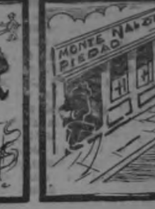
HISTORIETA MUDA (Conclusión).