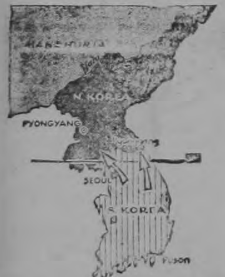
En la actualidad

acontecido, como pasa casi siempre que anda la politiquería de por medio. Para los republicanos toda la culpa fue del Departamento de Estado y de Mr. Acheson, quien ha tenido la gloria de continuar siendo durante todo el año el blanco favorito de los enemigos de la administración demócrata. Se trató de probar, aunque no se pudo, que la amenaza macartiana había sido hecha por instrucciones de Washington. Se afirmó, a toda boca, que la política de furia total contra los chinos rojos era la única posible salvación en el escenario oriental. Y, a la vuelta de tanto discurso y tanto desfile, el cansancio se apoderó de las mayorías del norte y el brillante general se esfumó de la escena, incluso del tapete electoral. Mr. Taft se encargó de esto último al afirmar su propósito de ser el candidato republicano para las próximas elecciones presidenciales.