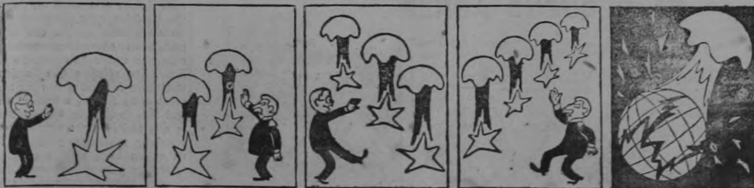
El duelo atómico.

Quizá una y otra esperanza sean exageradas. Lo que si parece ya hecho consumado es que los últimos experimentos de Nevada permiten la utilización de armas atómicas en los campos de batalla, substituyendo la artillería y las bombas usuales en los bombardeos tácticos. Esto significa una revolución tan drástica en el arte de la guerra como la que confrontaron — para su desgracia— los indios americanos contra las armas de fuego de los invasores blancos. — Estallado el conflicto el lado que disponga de tan tremendos instrumentos estaría en condiciones de hacer frente a su adversario con un mínimo de material humano.— Lo cual quiere decir que la ventaja básica del bloque soviético — sus inmensas hordas disciplinadas y peleadoras — habría dejado de existir. — Falta, sin embargo, que la prueba se haga de tal manera que no de-