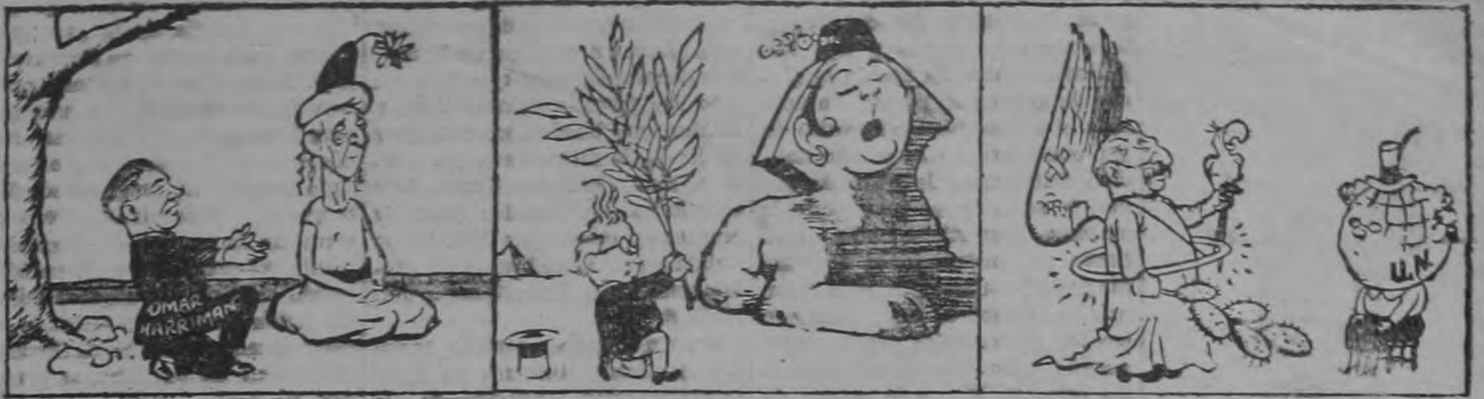
Los Trovadores de 1951.

Allá en el fondo y pese a cuanto hay de inicu y absurdo en las ocupaciones coloniales, lo cierto es que el pueblo sudanés tiene mayores garantías y probabilidades de trepar a más alto nivel de vida y democracia bajo la tutela inglesa que si regresa a poder de la camarilla feudal e insaciable que gobierna a Egipto. El problema íntimo de esos pueblos, como casi todos los otros del mundo islámico, está en la necesidad de echar por la borda un anciano andamiaje de tradiciones y costumbres esclavizadoras que se remonta a la aurora misma de la historia. Las masas fellahin no saldrán ganando gran cosa con que — y esta será la solución de la tempestad en un vaso de agua— le aumenten tantos o cuantos millones de libras esterlinas en la participación que tiene Farouk en las entradas anuales del canal. La mayor parte de ellos irá a parar, como hasta ahora, a los tapetes verdes de Montecarlo y a las encantadoras manos de las ganadoras de los concursos de belleza en la Riviera. — Será muy oriental, que el rey nilota derroche riqueza a manos llenas en los casinos elegantes, mientras la mayoría de sus súbditos vive muriéndose de hambre, pero resulta detestable para los conceptos modernos